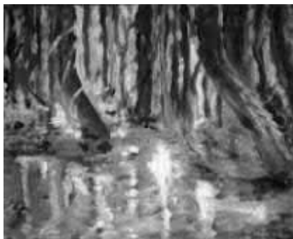
Картина: Габриела Цанева

след бурята - в локва край бордюра лодки от листа