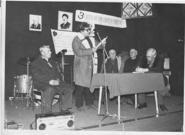
Събранието в Димитровград